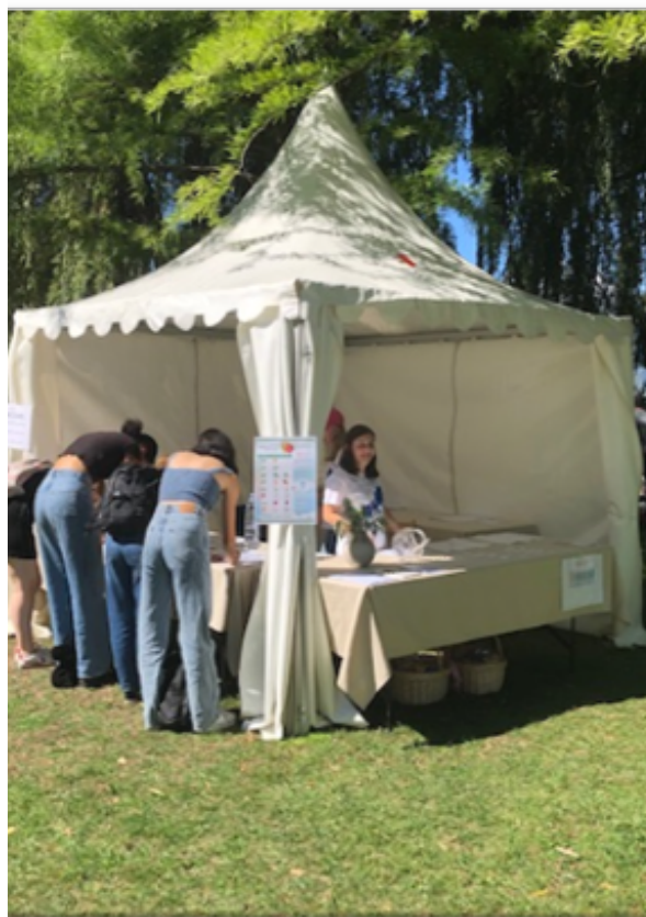
Stand "Journée de l'eau"