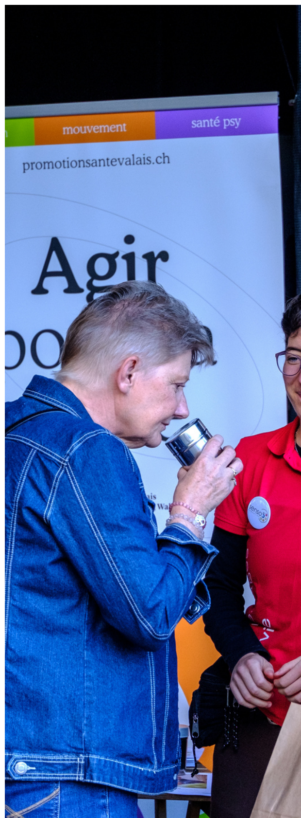
Stand journée valaisanne des Générations 60+, Foire du Valais