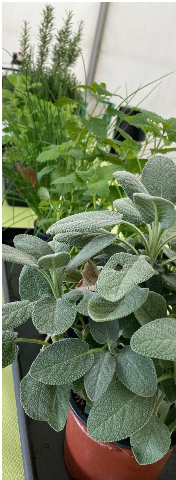
Atelier "eaux aromatisées à "Hérisson sous gazon"

3 Articles, 1 capsule radiophonique, mailing