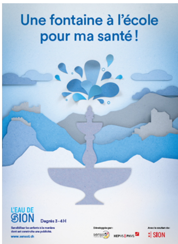
Affiche activité 1-2H

La Fondation Senso5 a participé au développement de nombreux projets et événements pour la Municipalité de Sion: