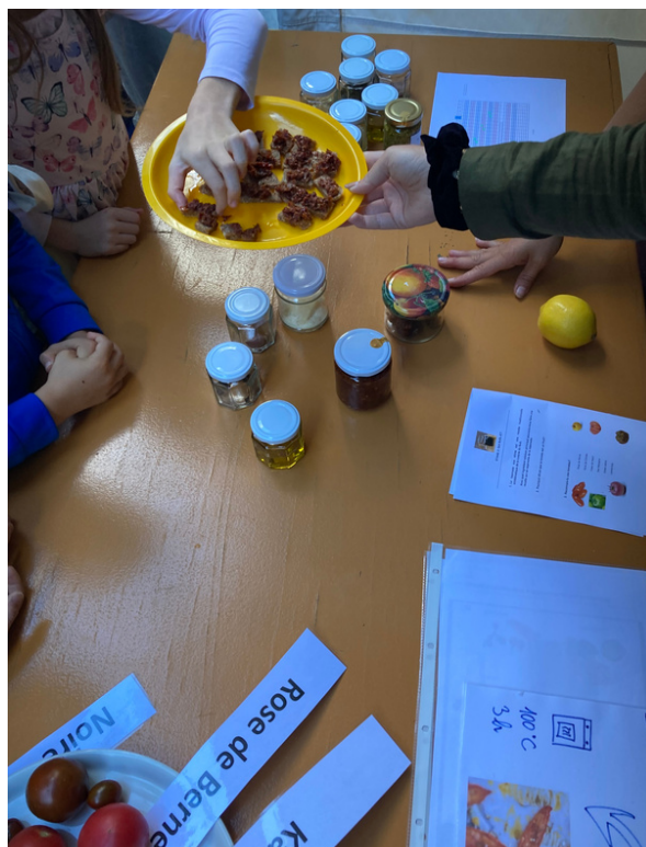
Stand Senso5 "Rallye des écoles" Fête du goût